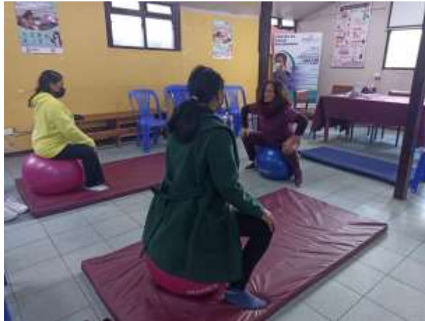
Imagen 1. Identificación de las primigestas con psicoprofilaxis obstétrica